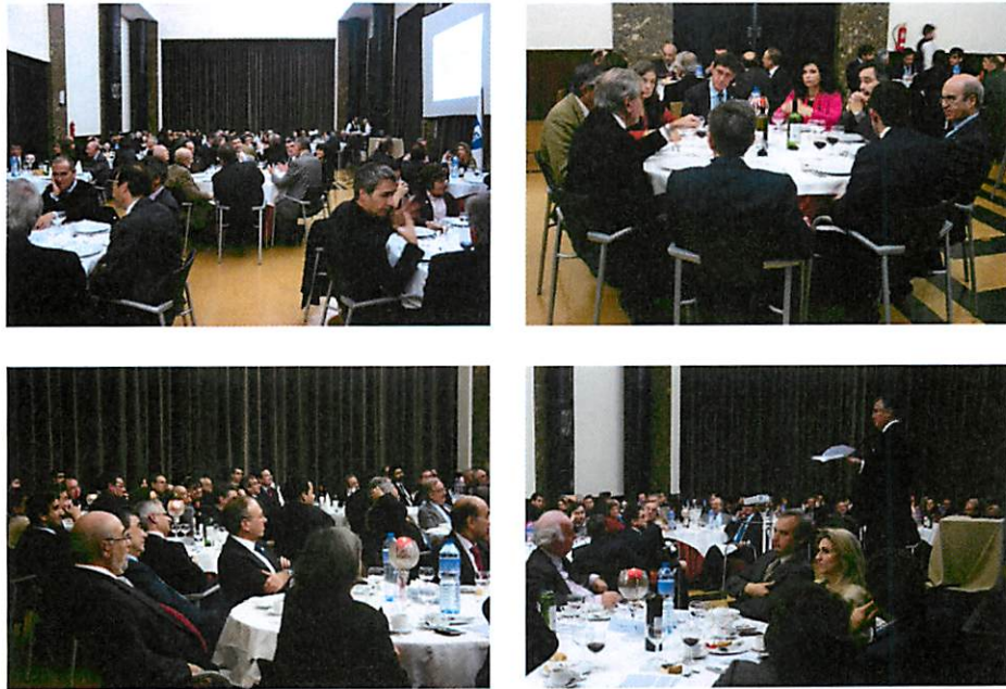
AAAIST - Encontro de 13 de Dezembro de 2012

O evento serviu também para angariar novos membros para a Associação tendo muitos dos convidados (mais de meia centena) aproveitado a oportunidade para preencher a ficha de candidatura a membro de pleno direito da Associação dos Antigos Alunos do IST. Estas admissões foram formalizadas já em 2013.